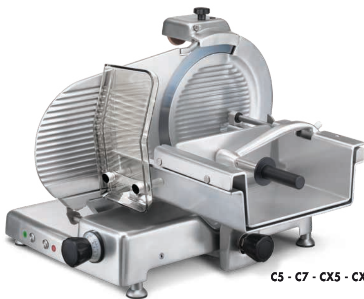
C5 - C7 - CX5 - CX7