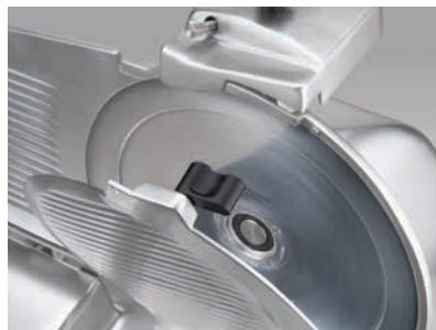
Dettaglio 350-370 GLX Detail 350-370 GLX